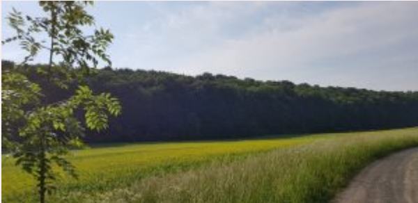
Blick auf das große Loh.