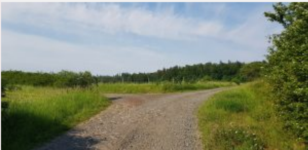
Am Ende vom Loh geht es den Wiesenweg, ca. 200 Meter, hoch.